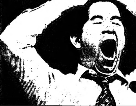
مسامر صفا في توكبريت خلال فترة انعقاد اجتماعات مجلس إدارة شركة عمان للخدمات المالية (القدس)

الين - القدس العربي: خوف بشأن الين تهبط بمؤشرات البورصات العالمية، وذلك في ظل حالة عدم اليقين.